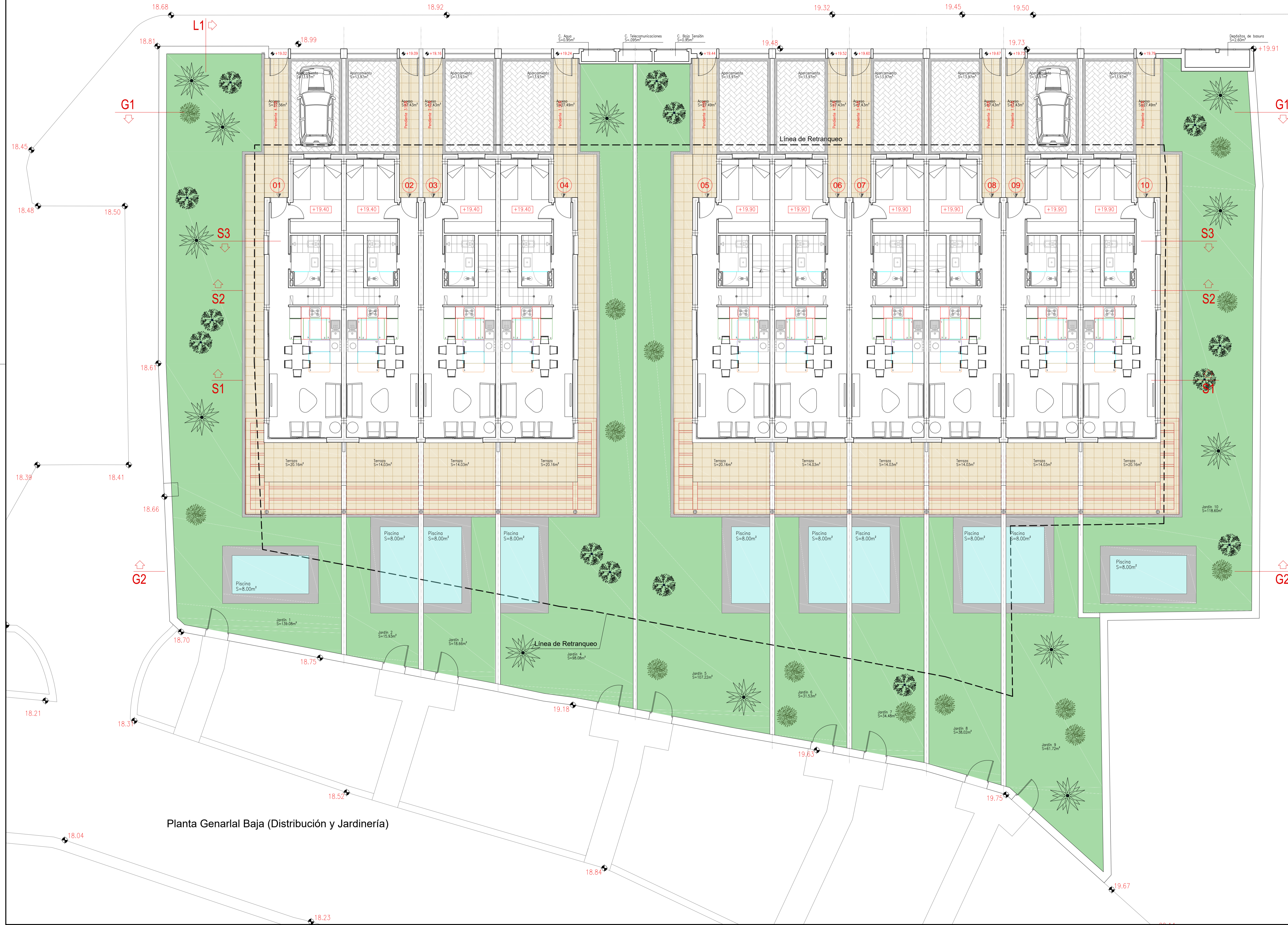
Planta General Baja (Distribución y Jardinería)

Superficie ajardinada 663,32m 2 > 20% Superficie Parcela 1930,62m 2 (Mínimo zona ajardinada 386,12m 2 )